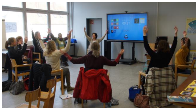
Text und Fotos: Martin Zurborg